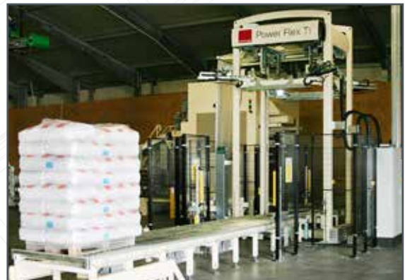
Stretchwickler (Drehteller- und Drehrarmwickler) sowie Haubenstretcher in TOP Qualität.